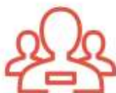
Actividades en grupo