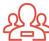
Actividades en grupo

Oferta de viaje combinado organizado y comercializado por la agencia de viajes CLUB CLAN 2000, S.L. (que opera bajo la marca comercial Gruppit y es titular del dominio www.gruppit.com ), con NIF B63625388, domicilio social en Barcelona (08036) en C/ Provença 212, bajos, Tel: 93.452.76.78 y que dispone también de oficina comercial en Madrid (28001) en C/ Velázquez 57, bajos, con telf. 91.423.70.58. También puede contactar con CLUB CLAN 2000, S.L. a través del e-mail de contacto: info@gruppit.com .