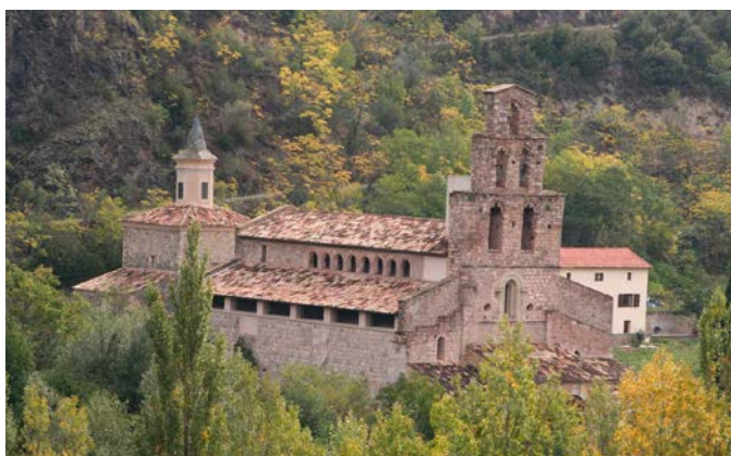
Monasterio de Gerri de la Sal

Almuerzo, Regreso en autocar a Sort y cena en el hotel Pessets.