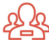
Actividades en grupo

Oferta de viaje combinado organizado y comercializado por la agencia de viajes CLUB CLAN 2000, S.L. (que opera bajo la marca comercial Gruppit y es titular del dominio www.gruppit.com ), con NIF B63625388, domicilio social en Barcelona (08036) en C/ Provença 212, bajos, Tel: 93.452.76.78 y que dispone también de oficina comercial en Madrid (28001) en C/ Velázquez 57, bajos, con telf. 91.423.70.58. También puede contactar con CLUB CLAN 2000, S.L. a través del e-mail de contacto: info@gruppit.com .