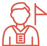
Asistencia en destino

Para este viaje te vamos a dar todas las pautas para que puedas llevar a cabo esta experiencia junto a tus compañeros de aventura y un teléfono de contacto de nuestro representante local por si precisas algún tipo de ayuda durante la ruta.